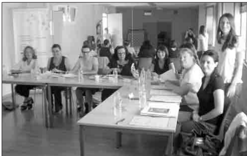
Le jury de sélection, réuni ce 19 juin aux Cannes, à Ajaccio, à l'initiative de BGE Ile Conseil

A noter : tous les autres candidats (ils étaient 6 en tout et trois dans chaque catégorie) se verront remettre un chèque de 300 € par la ville d' Ajaccio qui, depuis 3 ans maintenant, encourage ainsi les porteurs de projet à poursuivre leurs initiatives.