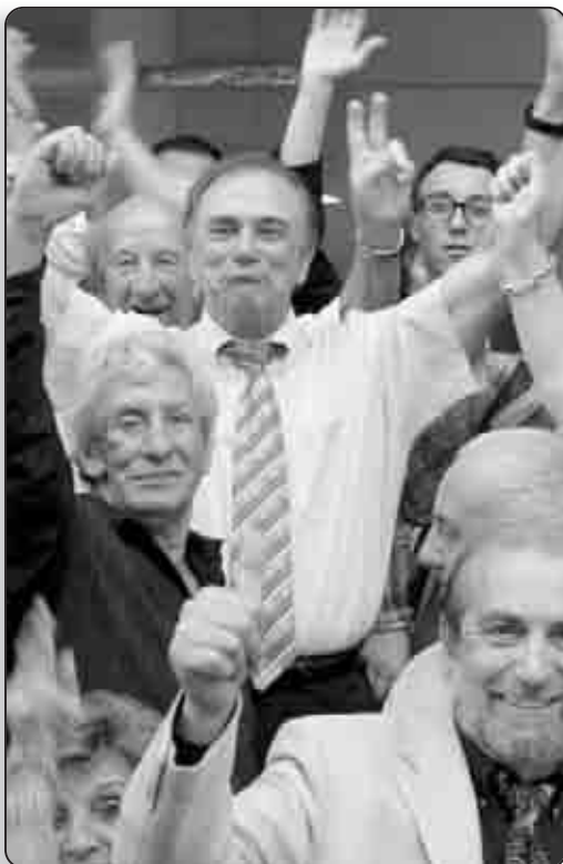
Sauveur Gandolfi-Scheit poursuit son chemin parlementaire mais dans les rangs de l'opposition

A 31 ans, le voilà donc plus jeune député de l' Histoire de Corse et quasi dans le duo de tête de l' Assemblée Nationale – jeunesse s'entend - aux côtés d'une Marion Maréchal-Le Pen (une autre « bleue », plus « marine ») ou d'un Gérald Darmanin , respectivement de 2 et 9 ans ses cadets et seuls à représenter la tranche des « moins de trente ans ». Laurent Marcangeli compte en tout cas dans les 38% de députés élus pour la première fois. En application de l'article LO121 du code électoral, les pouvoirs de la précédente Assemblée ayant expiré le mardi 19 juin à minuit, le jeune Ajaccien est entré dans ses nouvelles fonctions le mercredi 20 juin 2012. Comme ses pairs, il aura été accueilli au « bercaïl » pour y accomplir toutes formalités nécessaires. Avec