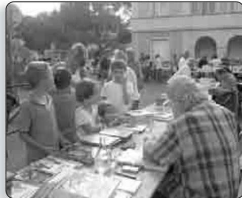
L'édition 2010 de « Lire au soleil »