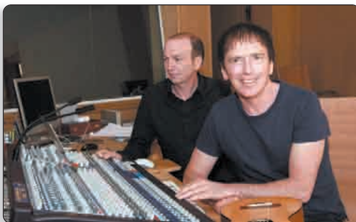
Dans le studio Alma à Tagliu Isulacciu