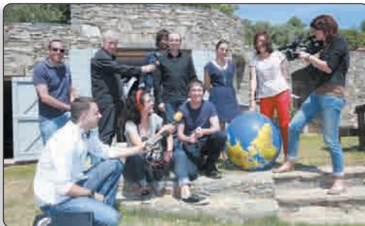
La presse suisse s'est intéressée de très près aux chanteurs «tavaninchi»