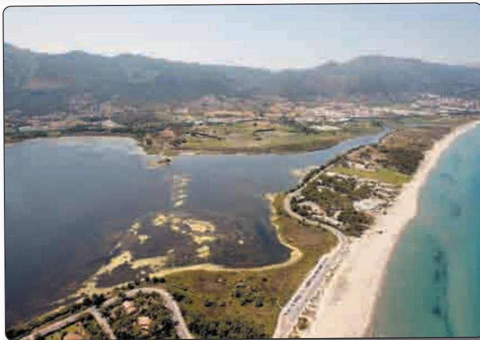
L'étang de Biguglia et le cordon lagunaire de la Marana, des milieux à protéger

L'Agence de l'eau Rhône-Méditerranée et Corse, établissement public dépendant du Ministère chargé du développement durable, vient de publier son rapport 2010 sur l'état des eaux de Corse. Selon ce document, 80% des cours d'eau insulaires et 62% des eaux côtières sont jugés en bon état, se rapprochant ainsi des objectifs de résultats à court terme du SDAGE. L'état des étangs littoraux, jugé à 100% mauvais, inspire, lui, de vraies inquiétudes.