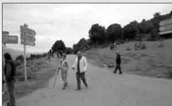
Reconnaissance pédestre du GR VTT Castagniccia-Morosaglia-Moltifao

«DEPUIS L'ORIGINE, NOUS COMBATTONS L'IDÉE QUE LES TERRITOIRES RURAUX ET MONTAGNARDS SONT IRRÉMÉDIABLEMENT CONDAMNÉS À LA RÉSIGNATION ET AU NON DÉVELOPPEMENT. SI NOUS LES LAISSONS MOURIR, NOTRE IDENTITÉ NE S'EXPRIMERA PAS PLEINEMENT. »