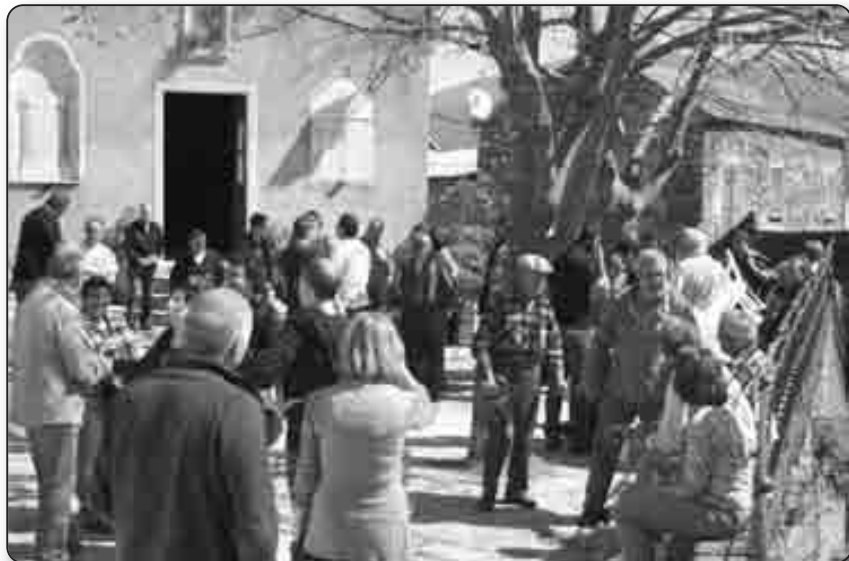
Avril 2011 : rencontre autour du patrimoine immatériel musical, à l'occasion de « Un ghjornu e una notte in Rusiu »

structure administrative. Avec 39 communes adhérentes, il constitue aussi la plus importante intercommunalité de notre territoire.