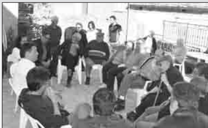
Débat sur les usages de la langue corse, en 2010, à Rusiu, dans la Pieve de Valle Rustie