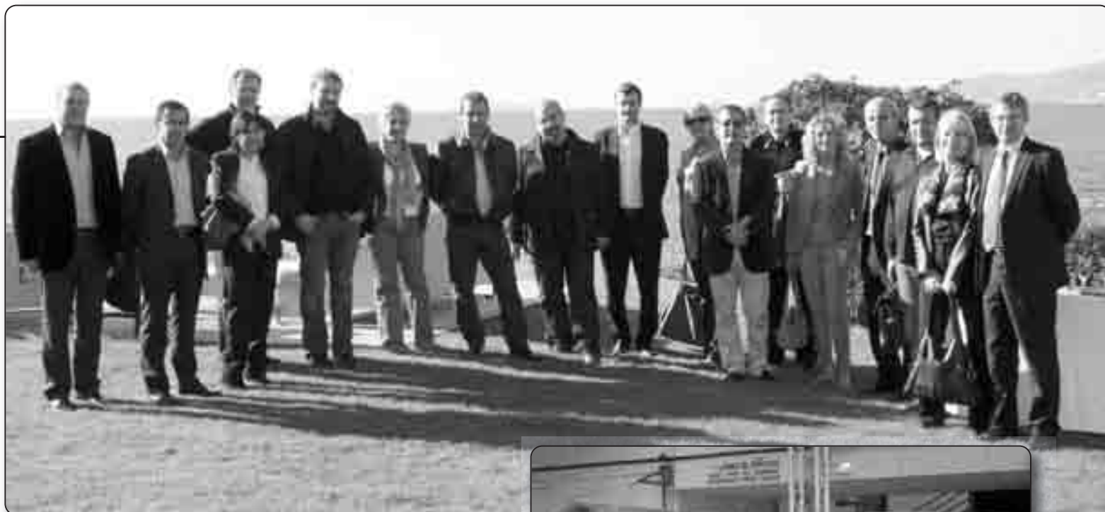
Les membres corses de la communauté d'Oseo Excellence

années. Des entreprises qui représentent aujourd'hui en cumulé 46 milliards d'euros de chiffre d'affaires et 315 000 salariés.