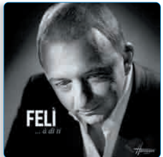
A Di Ti est dans les bacs

Mais cette île reste la source des plus grands bonheurs comme le retour que chante A di ti sur le thème du classique « Heureux qui comme Ulysse... » de Du Bellay qui a inspiré ici Ghjaccumu Fusina . Loin de la mélancolie, le chant de Feli est tourné vers la Corse contemporaine que ce soit dans la part donnée au métissage des cultures, à l'intégration et à la communauté de destin Sona , ou dans l'espoir de vivre mieux - travail, famille, amour... - chez nous, avec les nôtres, en essayant de tourner ensemble la page d'un passé destructeur ( Di qui ) ; dans l'hommage sans réserve et l'encouragement à ceux qui ont construit la Corse ( Sempre ) ; ou à travers cette femme qui danse pieds nus, A pediscalza , évocation sensuelle d'une Corse libérée, nouvelle et moderne. Un vrai coup de cœur !